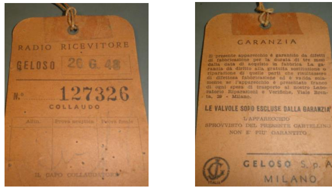
Figura 4, Cartellino di collaudo fronte-retro