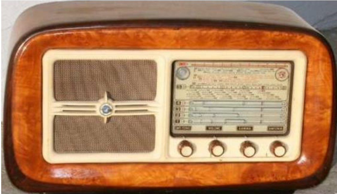
Figura 1, corpo ricevitore

Un ricevitore come questo era stato acquistato a metà degli anni 50 tra il 1954-55 dai miei zii, e poi non sappiamo che fine fece, forse dimenticato durante un trasloco.