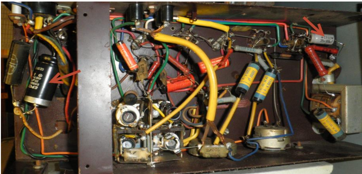
Figura 3, Condensatori sostituiti contrassegnati dalle frecce

Come si vede dalla foto, il circuito è perfetto per i suoi anni, i componenti non presentano rigonfiamenti, crepature o colature.