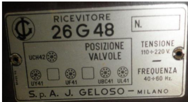
Figura 9, Foto targa posta dietro il ricevitore

Innanzitutto mi ha depistato, nella ricerca dello schema, la targhetta posta dietro il ricevitore