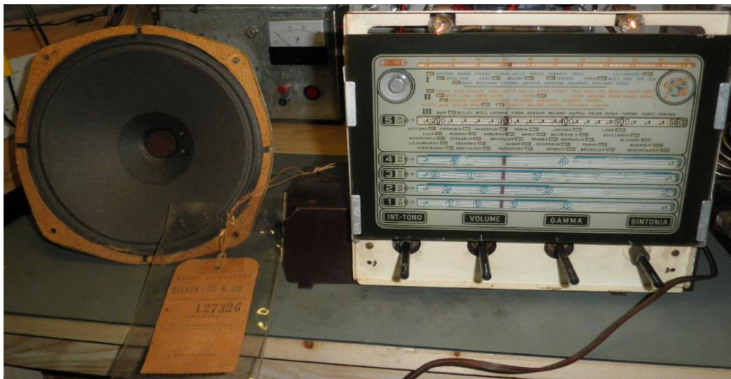
Figura 5, Ricevitore sul banco di lavoro